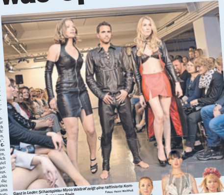
Ganz in Leder: Schauspieler Micro Storm zeigt eine raffinierte Kombination aus Leder und Seide.